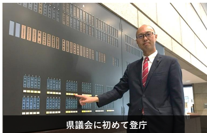
県議会に初めて登庁

また、24日には臨時会が開催され、所属する委員会も産業労働企業委員会、地方創生・行財政改革特別委員会などに決まりました。この産業労働企業委員会では産業政策や労働政策、さらには観光資源の活用や科学技術の振興も所管しています。特に中小企業振興やシティセールスをはじめとした観光促進はこれまで市議会議員として積極的に取り組んできた施策です。これまでの経験を活かして良い意味で新人らしくない活動をしていきたいと思っています。